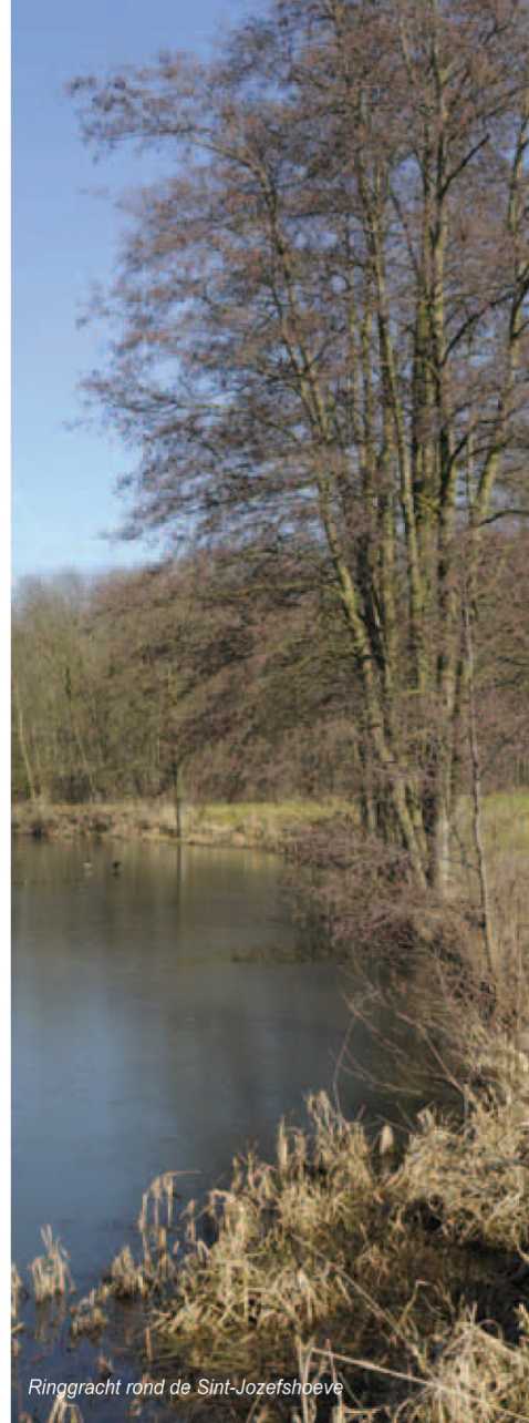
Ringgracht rond de Sint-Jozefshoeve

Volg het wandelpad rechtdoor, links is het nog altijd grondgebied Boortmeerbeek, rechts Kampenhout. Het oude, bijna honderd hectare grote Weisseterbos liep vroeger in westelijke richting, parallel met het kanaal.