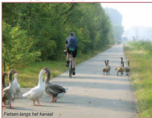
Fietsen langs het kanaal

Links en rechts zie je enkele kleine naaldboombestanden van fijnspar tussen de meerderheid van loofbomen als Amerikaanse en zomereik.