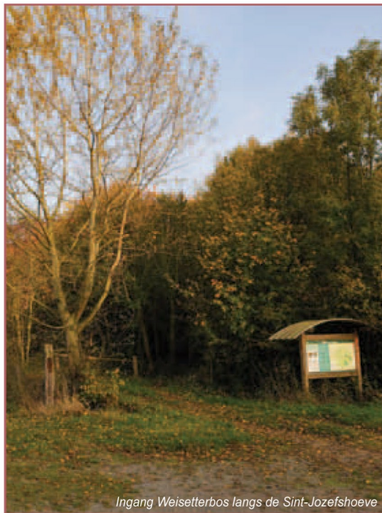
Ingang Weisseterbos langs de Sint-Jozefshoeve

Veel leuke tips dus voor een uitje op en langs het water! Aan jou de keuze!