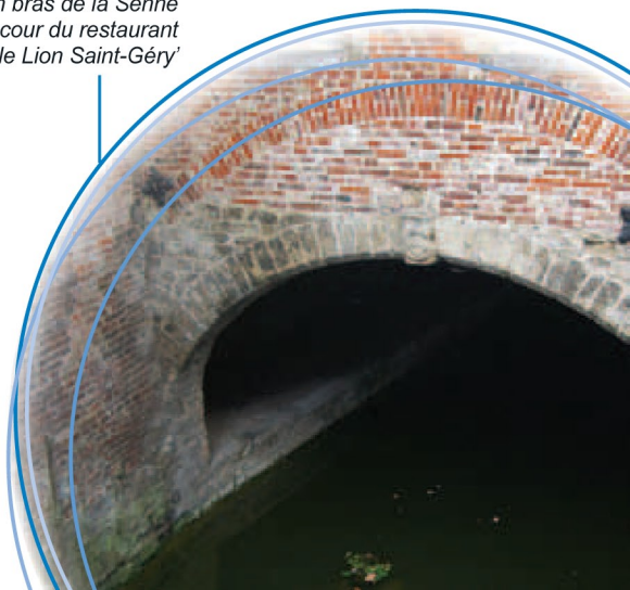
Ancien bras de la Senne dans la cour du restaurant 'le Lion Saint-Géry'

L'état sanitaire de la Senne, véritable égout à ciel ouvert et vecteur important de maladies, justifie à l'époque son recouvrement. Aujourd'hui, les choses se sont améliorées avec la construction de deux stations d'épuration nettoyant l'ensemble des eaux usées des bruxellois.